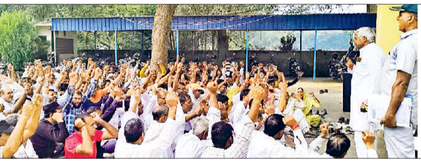
महेंद्रगढ़। कर्मचारियों को संबोधित करते यूनियन के पदाधिकारी।