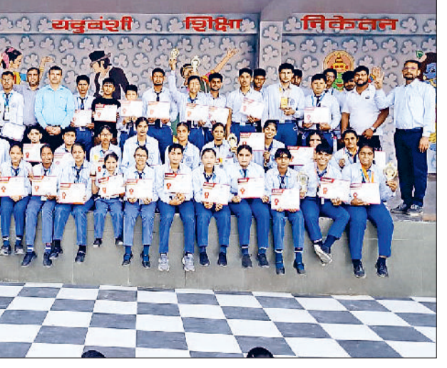
भिवानी। विजेता विद्यार्थियों को पुरस्कृत करते अतिथि।

हरिभूमि न्यूज ►► भिवानी यदुवंशी शिक्षा निकेतन मंदौला में सोमवार 27 अक्टूबर को पुरस्कार वितरण समारोह का आयोजन किया। इस अवसर पर उन विद्यार्थियों को सम्मानित किया, जिन्होंने रविवार 26 अक्टूबर को आयोजित यदुवंशी समूह की अंतर-विद्यालय प्रतियोगिताओं में उत्कृष्ट प्रदर्शन किया था। विजेता विद्यार्थियों को पुरस्कार एवं प्रमाण पत्र प्रदान कर सम्मानित किया। विद्यालय परिवार द्वारा सभी विद्यार्थियों का भव्य स्वागत किया। समारोह के दौरान विद्यालय प्रबंधन एवं शिक्षकों ने बच्चों और उनके अभिभावकों को हार्दिक बधाई और शुभकामनाएं दीं। सभी प्रतियोगिताएं 26 अक्टूबर को यदुवंशी समूह के विभिन्न