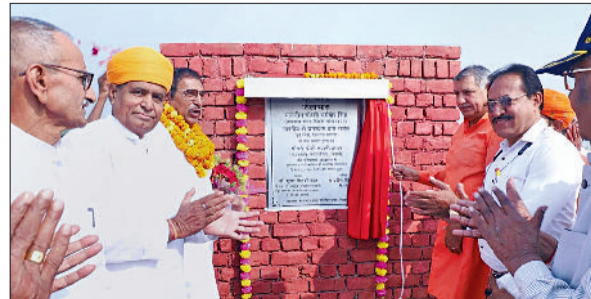
भिवानी। सीनियर सिटीजन क्लब के भवन का शिलान्यास करते सांसद धर्मवीर सिंह।