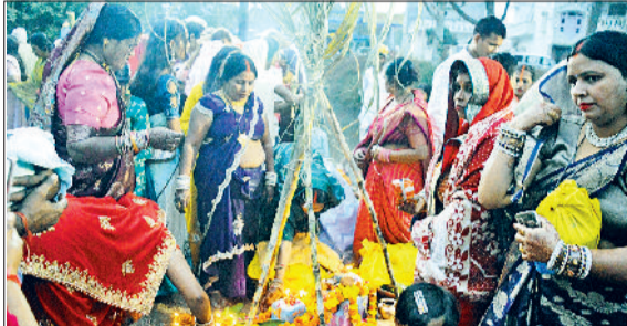
भिवानी। तोशाम बाइपास स्थित जुई नहर के घाट पर सूर्यदेव व छठ मईया की पूजा अर्चना करती प्रवासी महिलाएं।

उल्लेखनीय है कि 25 अक्टूबर शनिवार के दिन नहाय खाय, 26 को खरना लोहंडा, 27 को संख्या अर्घ्य व 28 अक्टूबर मंगलवार को प्रातः कालीन अर्घ्य देकर छठ पर्व मनाया गया। महिलाओं व श्रद्धालुओं ने सोमवार को छठ मईया का पूरी विधि विधान से पूजन किया। तोशाम बाइपास स्थित जुई नहर पर दिनभर प्रवासी महिला, पुरुष व बच्चों का जमघट लगा रहा। इसके अलावा शहर के बाहरी क्षेत्रों में खाली प्लॉटों में गहरे गड्ढे बनाकर उसमें पानी भरकर छठ पूजन के लिए अस्थायी व्यवस्था की। प्रवासी परिवार वर्षभर छठ पर्व आने का इंतजार करते हैं। पूर्वोत्तर प्रदेशों के लोगों के लिए ये सबसे बड़ा एवं महत्वपूर्ण