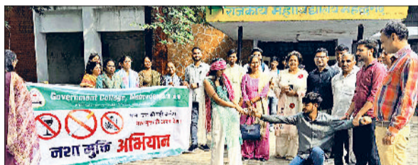
महेंद्रगढ़। नशे के विरुद्ध नुकड़ नाटक प्रस्तुत करते हुए।