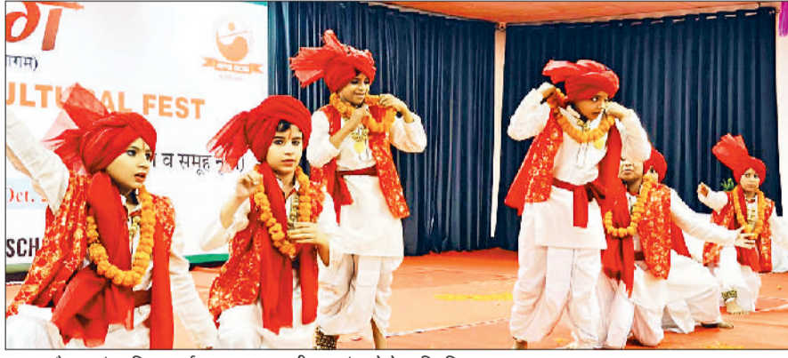
4 नारनौल। सांस्कृतिक कार्यक्रम प्रस्तुत करती छात्राएं।