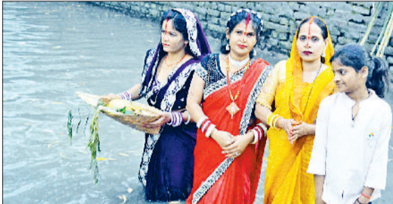
भिवानी। जुई नहर के घाट पर डूबते सूर्य की पूजा अर्चना करती प्रवासी महिलाएं।