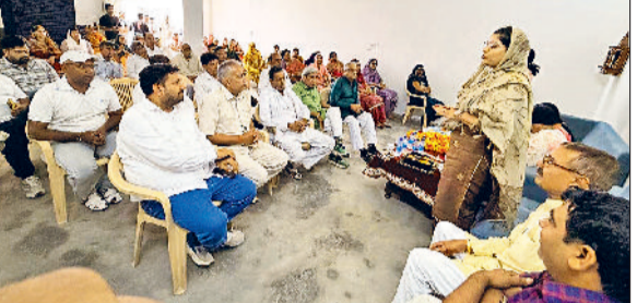
भिवानी। आयोजित कार्यक्रम में संबोधित करती महिला नेत्री।