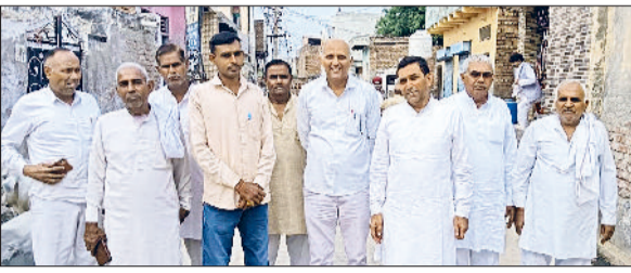
भिवानी। जनसम्पर्क अभियान के दौरान लोगों से बातचीत करते हुए।