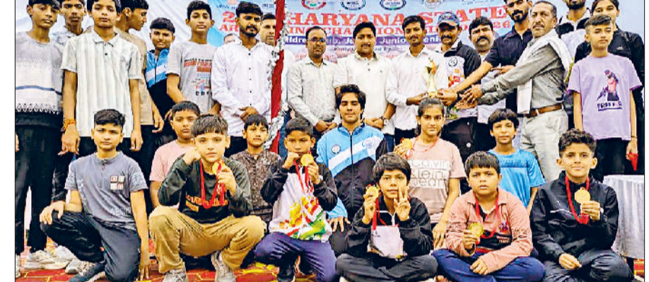
नारनौल। समापन पर पदक विजेताओं को सम्मानित करते हुए।

आंदोलन को तेज किया जाएगा। जिसमें महेंद्रगढ़ शहर की जल व मूल व्यवस्था को बंद करने के लिए संगठन को मजबूर होना पड़ सकता है। जिसकी तमाम जिम्मेवारी कार्यकारी अभियंता व तीनों उपमंडल अभियंताओं की होगी।