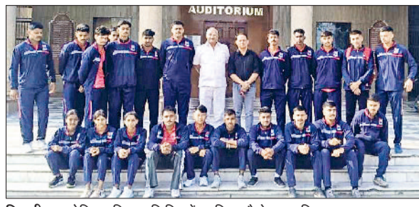
भिवानी। आयोजित प्रशिक्षण शिविर में उपस्थित कैडेट्स व शिक्षक।